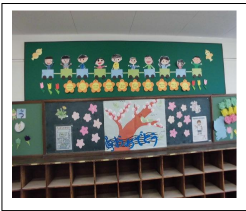
<1年生 入学おめでとうございます>