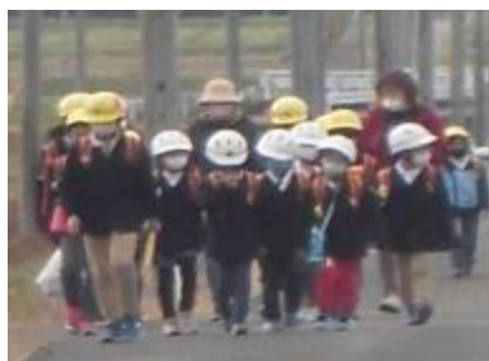
初めての集団登校です。 1年生も元気に登校しました。