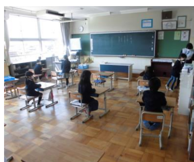
2・3年生の授業風景