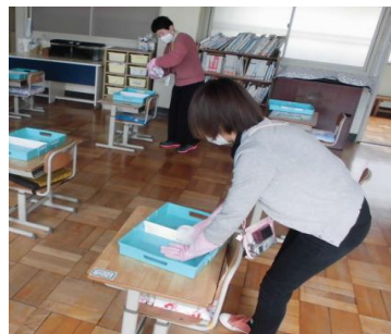
放課後、机やいすの消毒をしました。