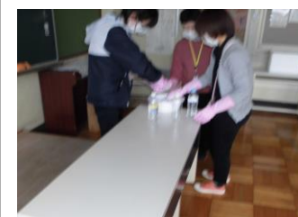
放課後、教室の消毒をしました。