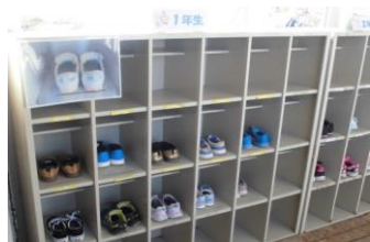
みんなきれいに靴が入っています。